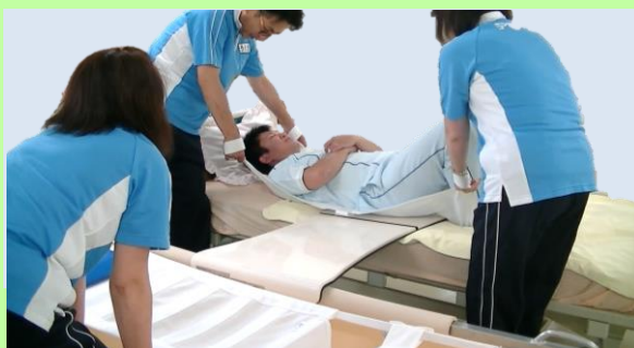
生地：ターポリンシート