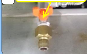
1 ボールバルブつまみ